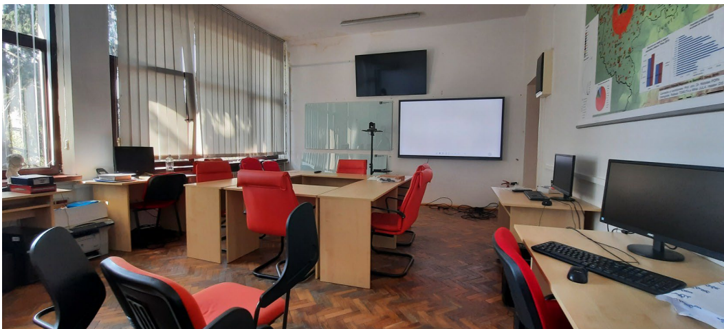
Sală pentru doctoranzi și activitățile de doctorat ale acestora

De asemenea, în sala 137 (Sala Doctorală) a fost amenajat un spațiu prin excelență dedicat doctoranzilor, desfășurării activităților didactice în cadrul școlii doctorale, elaborării și susținerii rapoartelor de progres, susținerii tezelor de doctorat în cadrul departamentului și diferitelor ateliere doctorale. Sala este dotată cu 6 calculatoare, un videoproiector, o imprimantă și un scanner, deși mulți doctoranzi lucrează pe propriile laptopuri. Sala dispune de conexiune wireless cu biblioteca Universității de Vest și cu bazele de date cu reviste.