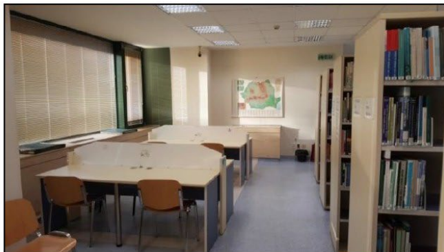
Geography Library of the "Eugen Todoran" Central University Library