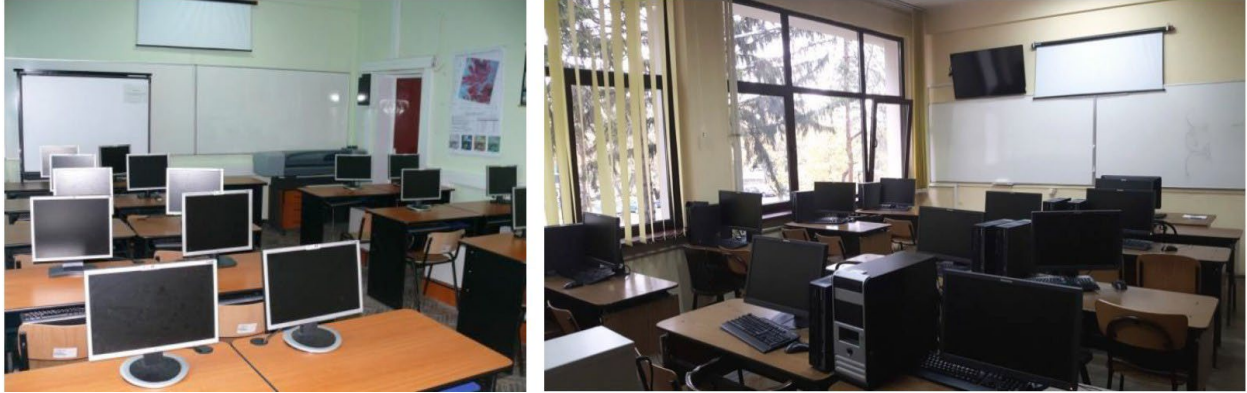
Laboratoare de Sisteme Informaționale Geografice, cartografie digital